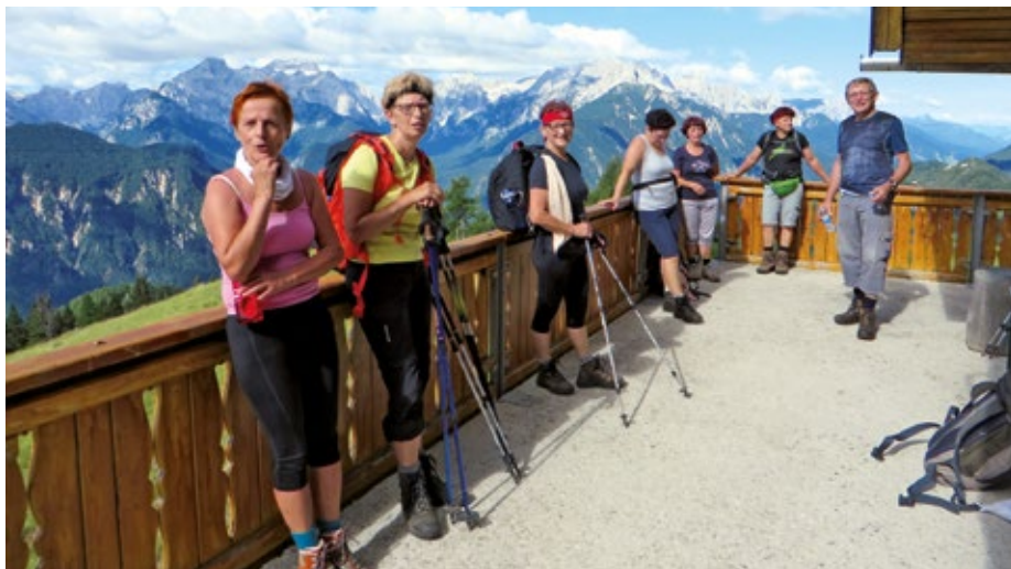
Na Dovški babi – v ozadju Julijske Alpe

Na ta dosežek smo zelo ponosni. V naš program in izvedbo pohodov smo vključili tako lažje z udeležbo na organiziranih pohodih (februarski občinski pohod na Krvavec, Pohod po Trstenjakovi poti, Jurčičev pohod, Pohod po Krpanovi poti, jesenski