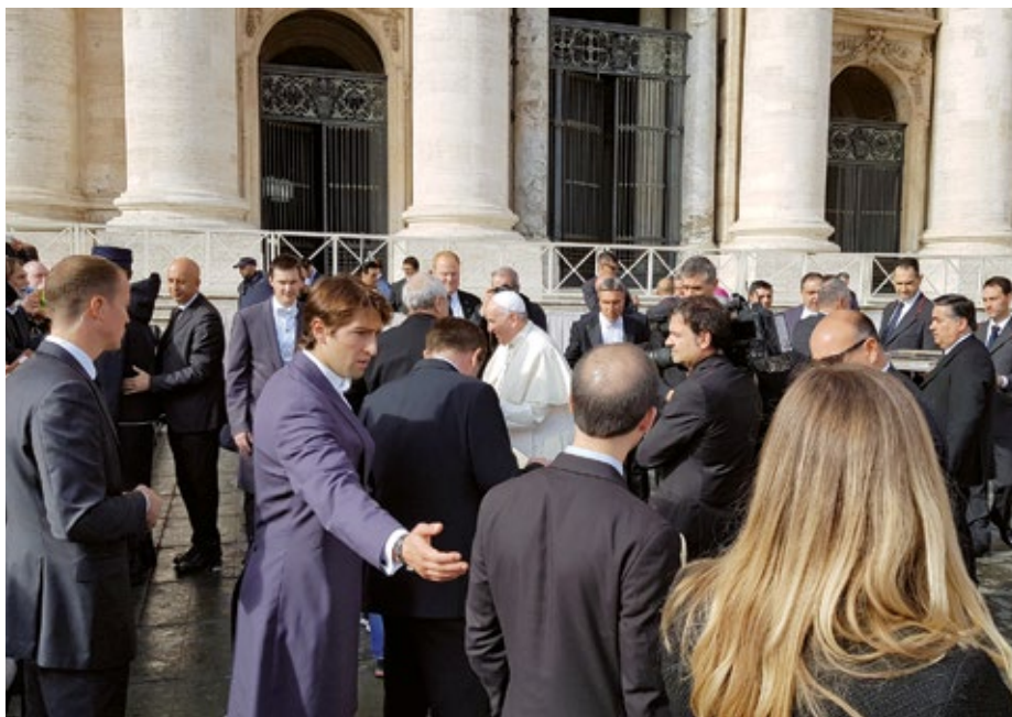
Kunstljeva prejšnja postaja je bil Vatikan, tam je ponavadi ostal tudi med božičnimi prazniki

Lahko rečem, da smo na uradu predsednika vlade in na zunanjem ministrstvu delali z roko v roki, da smo skušali izkoriščati vse pozitivne povezave, nesporno je bila zelo pomembna vpetost tedanjih Slovenskih krščanskih demokratov v Evropsko ljudsko stranko, mislim, da je devet od dvanajstih voditeljev držav članic Evropske unije pripadalo tej stranki, kar je pripomoglo k podiranju nekih stereotipov. Druga stvar je izjemna enotnost vseh, ki so sodelovali v teh procesih. Vedno je sicer šlo tudi za neke manjše boje za pomembnost, vendar to je drugotnega pomena v primerjavi s tem, kako hitro se je doseglo mednarodno priznanje naše države, približno pol leta