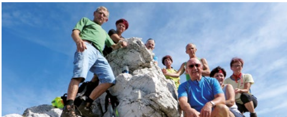
Na Mali Ponci z italijanske strani

Vseh pohodov se je udeležilo 2.058 pohodnikov.